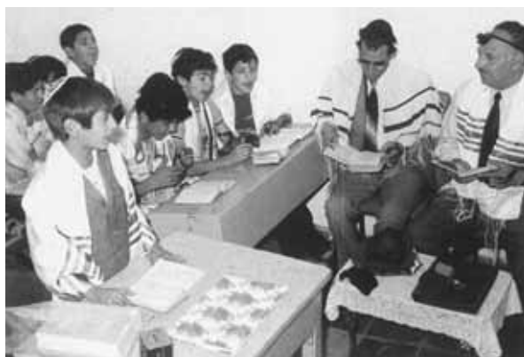
Můj otec, zcela vpravo, sleduje své studenty při návratu modlitby (rok 1975).

Zpráva o Aghově setkání se židovskou delegací se rychle roznesla. Jak zareagovali