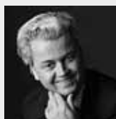
Předseda nizozemské Svobodné strany Geert Wilders , autor krátkého filmu Fitna.

Už brzy se tyto vlastenecké strany vůbec poprvé sejdou k výměně zkušeností. Možná to je počátek něčeho velikého. Něčeho, co na ►