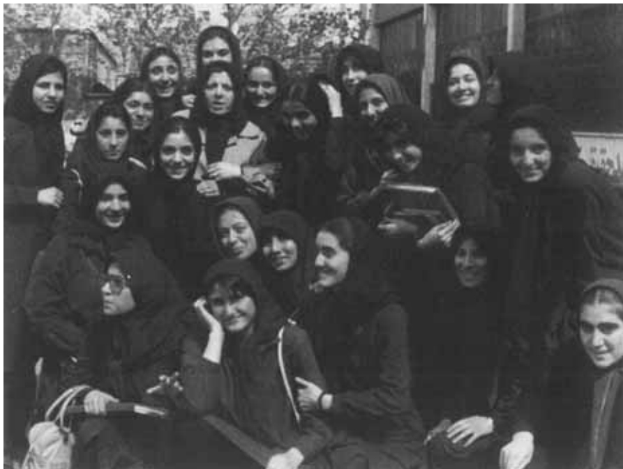
Třídní fotografie ze střední školy. Stojím v horní řadě, hned vlevo od vysoké dívky.

Nakonec jsme našli azyl, ale nebylo to právě snadné a bezbolestné. Nejprve se podařilo dostat do Ameriky mně a matce přes Vídeň, ale otec se rozhodl zůstat ještě v Teheránu, aby zařídil prodej našeho domu.