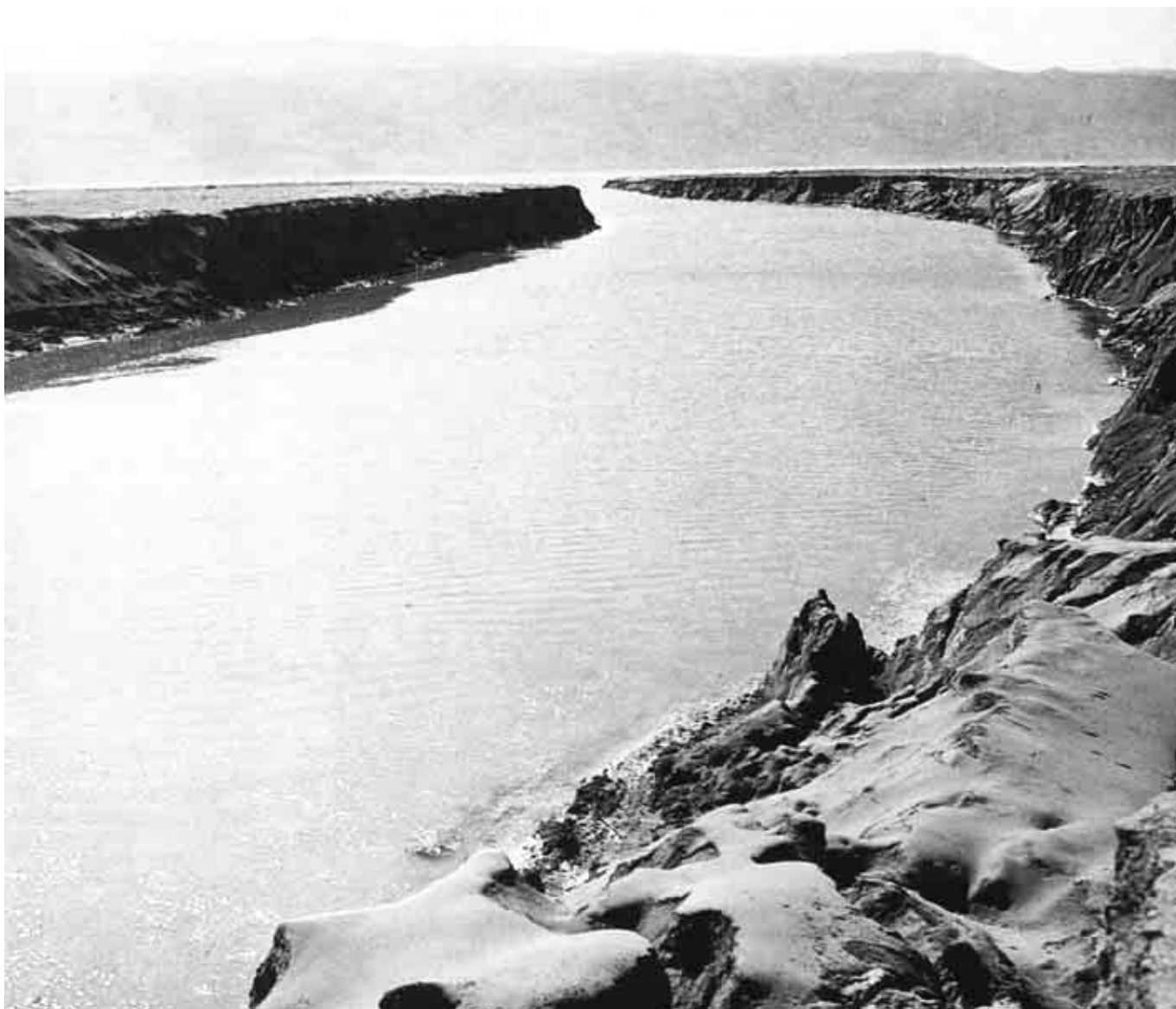
Jozue 3,15: „Když ti, kteří nesli schránu, přišli k Jordánu a nohy kněží nesoucích schránu se smočily na pokraji vod, tu vody řítící se shora zůstaly stát a postavily se jako jednolitá hráz.“ Je pro naši víru nezbytné věřit, že se vody Jordánu skutečně zastavily?

► tele ve vozech, ale poselství příběhu je o důvěře v Boha i tváří v tvář evidentní pohromě, nikoliv o počasí a přílivu či odlivu. Stále existují úkazy, které ani dnešní věda neumí vysvětlit, a možná ani nikdy umět nebude, ale které jsou stále jakožto přírodní jevy součástí stvoření a nejsou nadpřirozené.