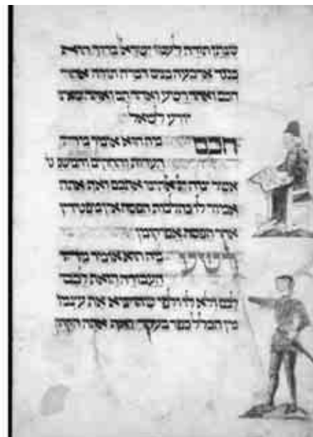
Ilustrace k pasáži o čtyřech synech v tzv. Washingtonské hagadě (1478, Střední Evropa, dnes uložena v Kongresové knihovně)