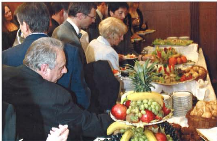
Chléb náš vezdejší dej nám...