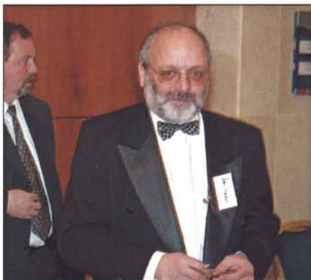
„Musíme našemu vedení udělat stejnou ostudu, jako oni nám“