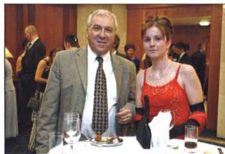
Kráska v červených šatech