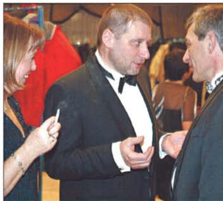
Jistota desetinásobku s Fidolačkou...