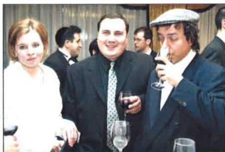
V pozadí šedá eminence plesu