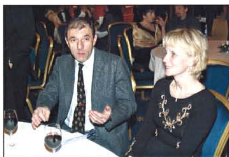
Budoucí sponzor plesu