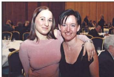
Jsmo krásné a víme to...